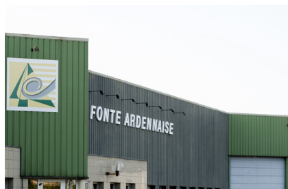
LFA2 Vrigne aux Bois (08)