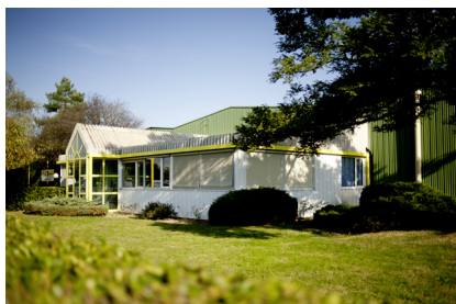
SED La Flèche (72)