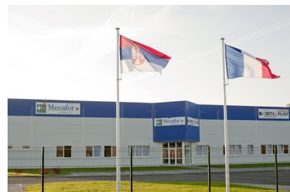
MECAFOR Kikinda (Serbie)