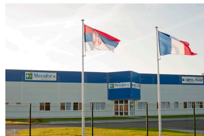
MECAFOR Kikinda (Serbie)