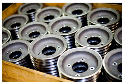
27 TOURS CNC