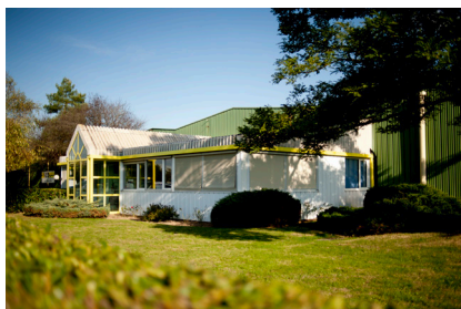
SED La Flèche (72)