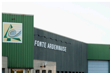
LFA2 Vrigne aux Bois (08)