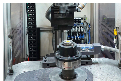
5 STATIONS D'ÉQUILIBRAGE

BROCHAGE, CONTRÔLE D'ÉTANCHÉITÉ, CONTRÔLE DE PROPRETÉ