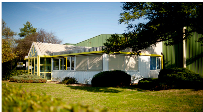
SED La Flèche (72)